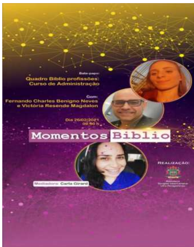
Figura 5 – Flyer da palestra sobre o Quadro Biblio Profissões: Curso de Administração.

O vídeo da apresentação tem 144 visualizações até a presente data e está disponível em < https://www.youtube.com/watch?v=mA4ZdHmRa8Q >. Segue o folder de apresentação: