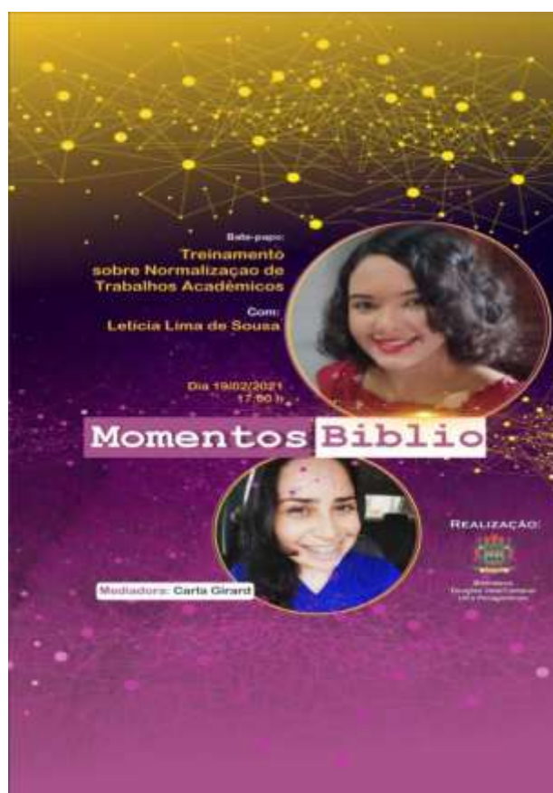
Figura 5 – Flyer da palestra sobre Treinamento sobre Normalização de Trabalhos Acadêmicos.

O vídeo conta com 114 visualizações até o momento e está disponível em: < https://www.youtube.com/watch?v=WdwOR9y-t-w >. Segue o folder de apresentação: