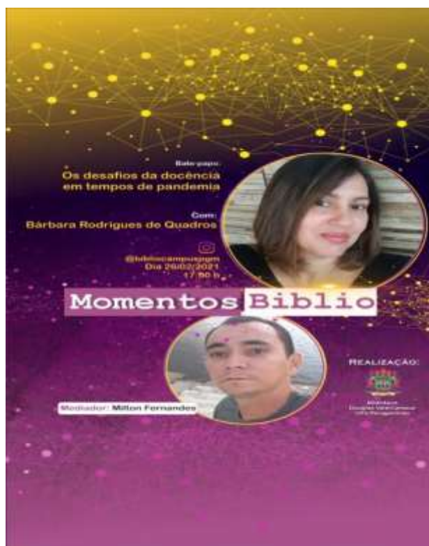
Figura 5 – Flyer da palestra sobre os desafios da docência em tempos de pandemia.

O bate-papo já está com 78 visualizações e encontra-se disponível em < https://www.youtube.com/watch?v=TQY4iWCr2ZA >. Segue o folder de apresentação: