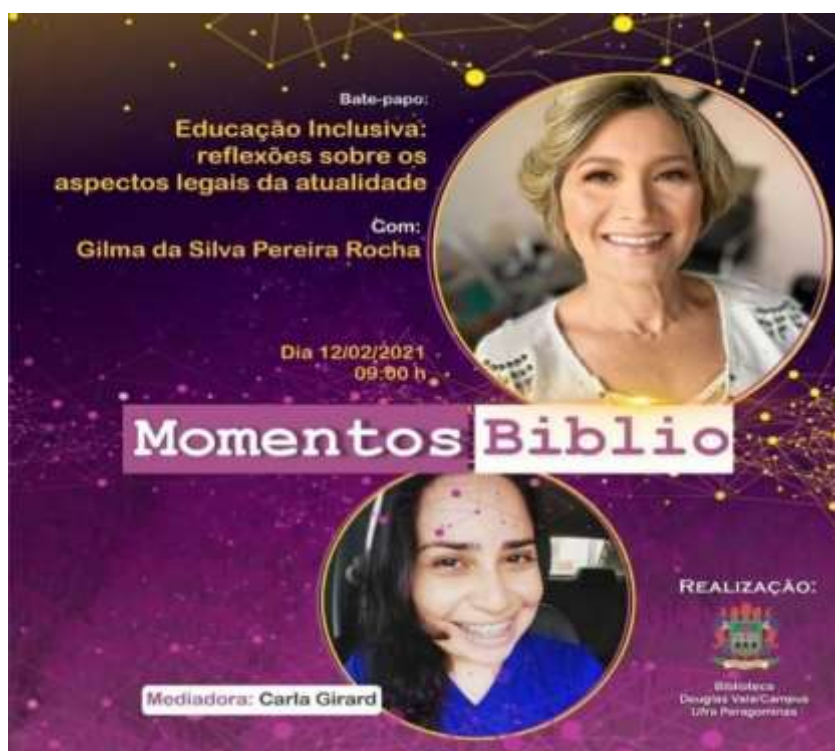
Figura 3 – Flyer da palestra sobre Educação inclusiva: reflexões sobre os aspectos legais da atualidade.

O vídeo tem, até o momento, 145 visualizações e seu link é: < https://www.youtube.com/watch?v=0Uf0fWJmkv0 >. Segue o folder de apresentação.