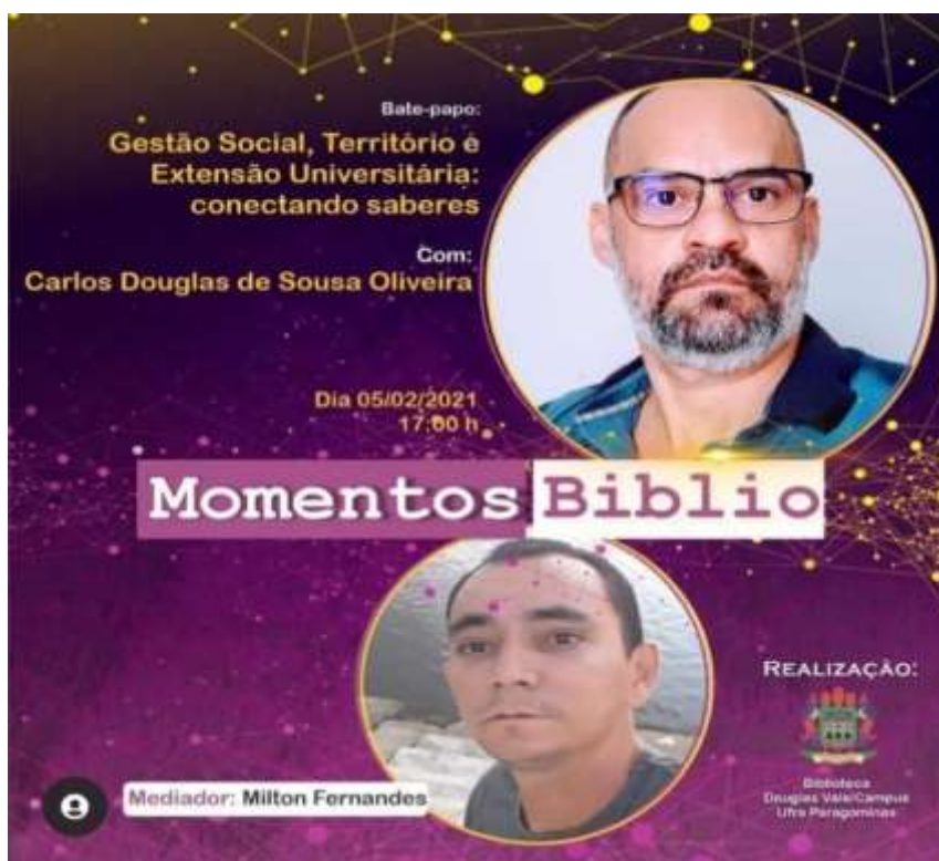
Figura 2 – Flyer da palestra sobre Gestão Social, Território e Extensão Universitária: conectando saberes.

O vídeo do bate-papo conta, até o momento, com 80 visualizações e seu link é: < https://www.youtube.com/watch?v=N4uvOtvUNcM >. Segue o folder de apresentação abaixo.